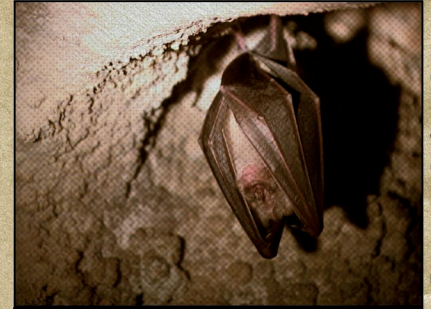
Ratpenat de ferradura

Com tots i totes sabeu, fins i tot el professor Roots ho sap, a la nit no es veu gens ni mica. Hi ha alguns animals que hi veuen tan bé que ni tan sols a la foscor tenen problemes, d'altres animals hi veuen molt i molt poc i no obstant això no es ensopeguen amb cap obstacle, sabeu a quins ens referim? Exacte, als ratpenats. Per orientar-s'hi utilitzen un sistema similar als radars amb que estan equipats vaixells i avions. Per fer-vos una idea, penseu en l'eco. El tornaveu que tan ens agrada quan cridem a un penya-segat o a una sala gran buida està produït pel xoc i rebot del so de la nostra veu contra les parets. Els ratpenats emeten uns xiscles tan aguts que nosaltres no som capaços de captar-los. L'eco d'aquest xiscles és interpretat en la seva ment i és així com veuen, potser millor que nosaltres amb la nostra visió, sembla mentida, no penseu? A Espanya hi ha més de 30 espècies de ratpenats, totes protegides per la llei.